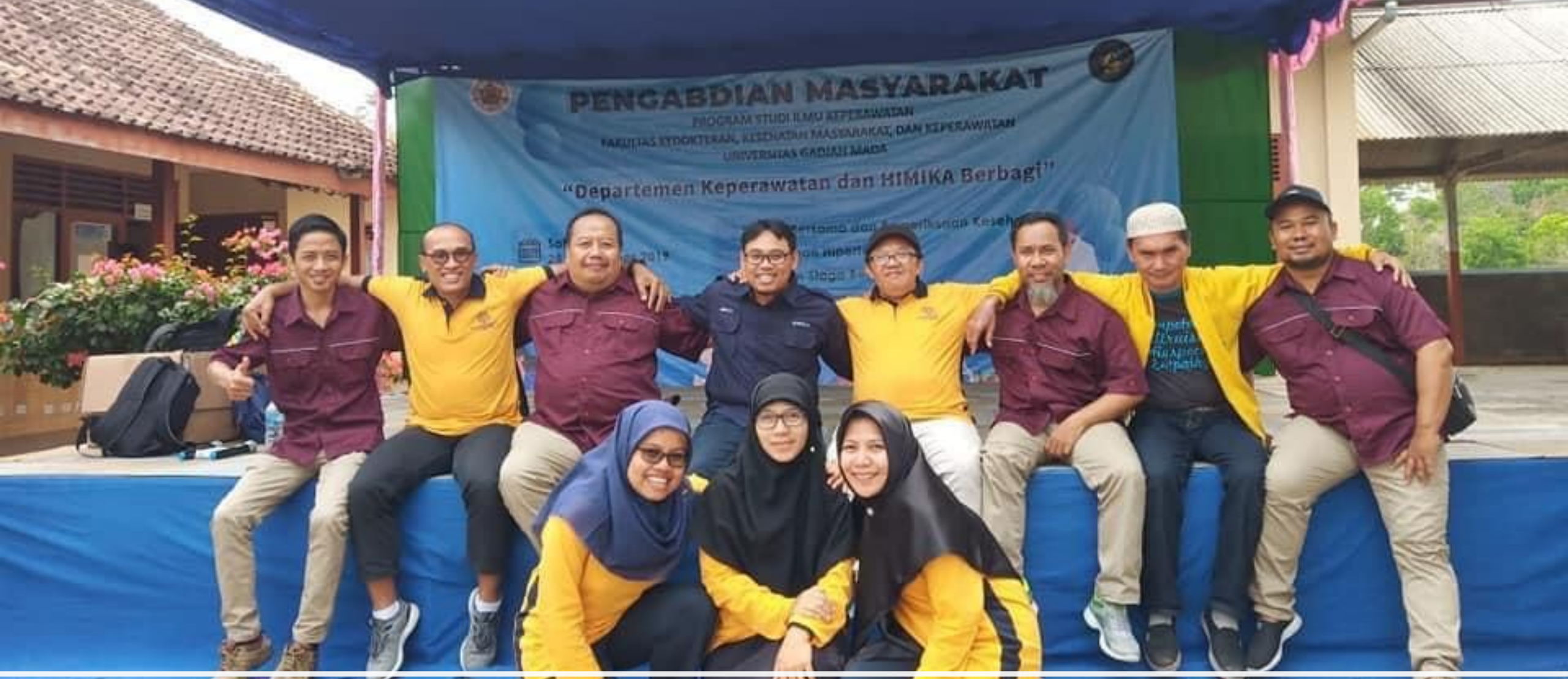
Dosen dan Tendik Departemen Keperawatan Jiwa dan Komunitas FKKMK